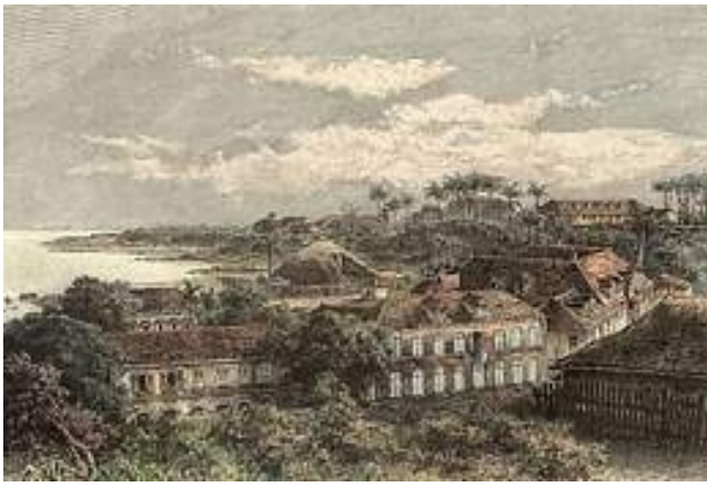
Общий вид Кайенны в конце XVIII в.

По прибытии в Кайенну ссыльных поместили отдельно: Бийо – в форт, Колло – в коллеж, с 1789 года превращенный в тюрьму.