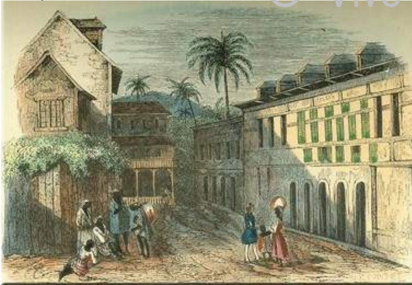
Центральная улица Кайенны в конце

В это время губернатором Гвианы был Франсуа-Мари Куант де Фийен (Cointet de Fillain, 1766-1809). Похоже, что он испытывал неловкость, исполняя неоправданно суровый приказ. Коллеж-тюрьма находился на площади Кайенны, где Куант имел обыкновение прогуливаться по вечерам. Ему «неодолимо» захотелось увидеть человека, «с такой энергией защищавшего солдат Шатовье». Разговор с Колло, один, а за ним другие, дали Куанту представление о политической подоплеке осуждения ссыльных, и отныне он всеми силами старался смягчить их положение.